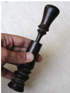
Briquet pneumatique asiatique en bois