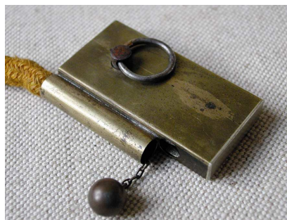
Le briquet à émeri annonce les briquets actuels