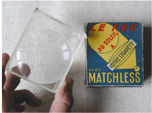
Matériel en bois servant à produire du feu (en haut). Briquet à silex en métal (au centre). Briquet solaire de marque Matchless (en bas).